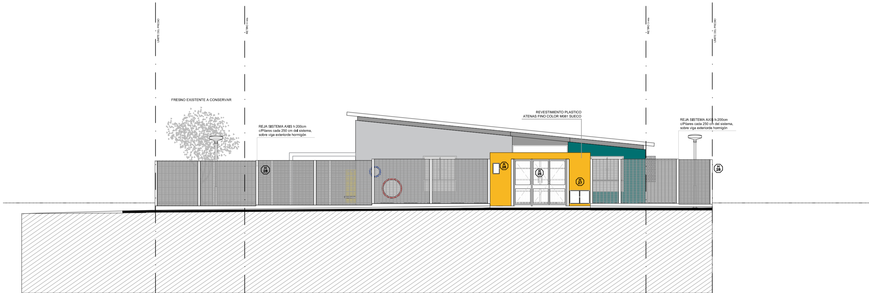
FACHADA NOROESTE CON REJAS